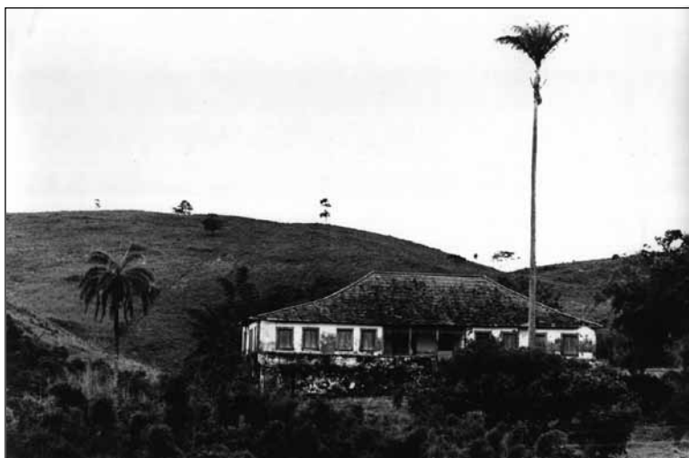
Fazenda Guaribú, Vassouras.