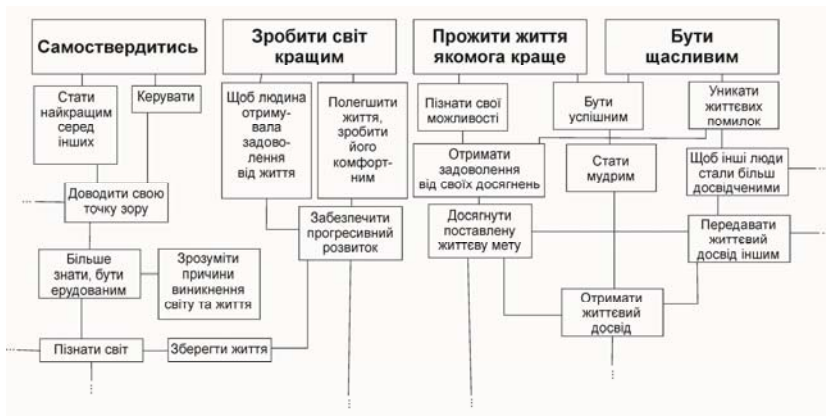
Рис. 2. Фрагмент структури світогляду О. Т., 19 років (вибірка юнаків)