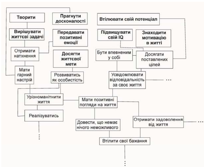
Рис. 3. Фрагмент структури світогляду Р. Б., 25 років (вибірка дорослих)

Відмінності між вибірками юнаків та підлітків при відповіді на питання «Навіщо людина заробляє гроші?» виявилися за кількістю вузлових категорій ( U_{\text{емп.}} = 37,500 ; p = 0,000 ) та індексом зв'язаності ( U_{\text{емп.}} = 88,000 ; p = 0,002 ). Між групою юнаків та групою дорослих існують відмінності за усіма кількісними індикаторами – кількістю граничних ( U_{\text{емп.}} = 89,000 ; p = 0,001 ) та вузлових ( U_{\text{емп.}} = 136,000 ; p = 0,043 ) категорій, індексом зв'язаності ( U_{\text{емп.}} = 125,500 ; p = 0,024 ), середньою довжиною ланцюга ( U_{\text{емп.}} = 115,500 ; p = 0,020 ) та індексом продуктивності ( U_{\text{емп.}} = 81,000 ; p = 0,001 ).