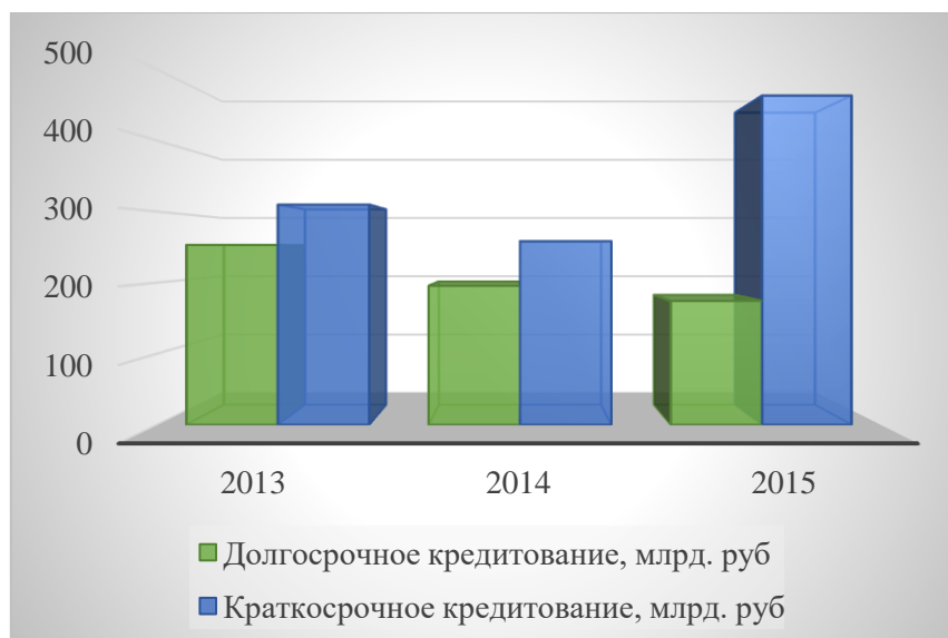
Рисунок 2. Соотношение краткосрочного и инвестиционного кредитования АПК Россельхозбанком в 2013–2015 г. г. (Составлено автором на основании: Годовые отчеты банка Россельхозбанка за 2013–2015 годы / Россельхозбанк: официальный сайт: www.rshb.ru/ ).

Соотношение краткосрочного и инвестиционного кредитования АПК Россельхозбанком отражено на Рисунке 2.