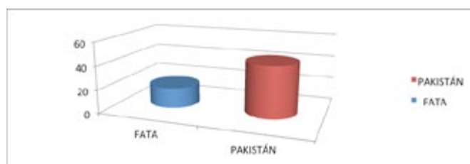
Gráfica 1. Comparación del indicador alfabetización en el área FATA con respecto al resto de Pakistán.