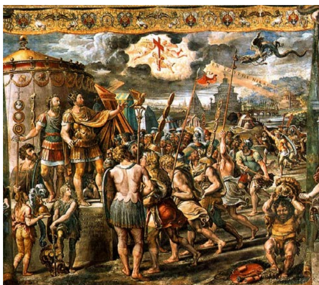
Рис. 2. Фреска Джулио Романо «Видение креста»

Чтобы понять появление коллективного видения необходимо иметь в виду, что в войсках Константина находилось уже много христиан, которых воодушевить на битву могла только их священная эмблема – святой крест, очевидно, что Константин с его свитой не могли не быть озабочены этим обстоятельством, переживая в то время, наряду с другими, мучительные религиозные сомнения (Бехтерев, 1915: 599).