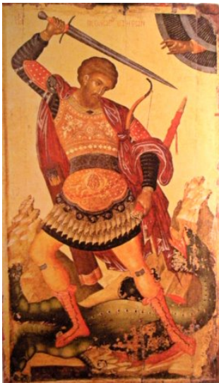
Рис. 4. Святой Теодор (Феодор)

Точно также обратное завоевание Иерусалима ознаменовалось коллективными видениями. В день этого взятия Саладином* многие из монахов видели, как луна спустилась на землю и затем вновь поднялась на свое место. Точно также толпы молящихся видели в эти дни, как в церквях из очей распятий и икон сочились кровавые слезы (Бехтерев, 1915: 600).