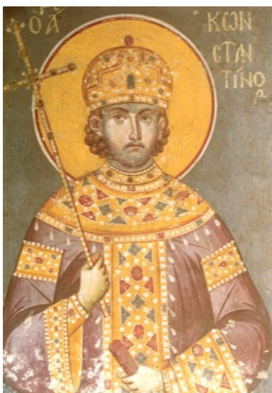
Рис. 1. Константин Великий – римский император.

Достаточно широко известен пример одной из коллективных галлюцинаций до крестового периода, которую имел Константин Великий† вместе со своей свитой перед решающей битвой. Это видение заключалось в лицезрении креста с надписью: «Сим побеждай!».