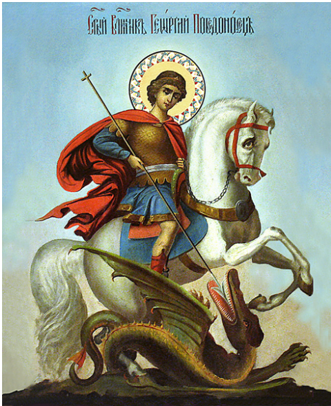
Рис. 2. Георгий Победоносец