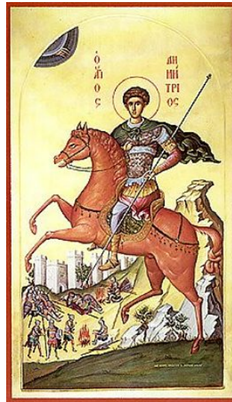
Рис. 3. Святой Димитрий Солунский