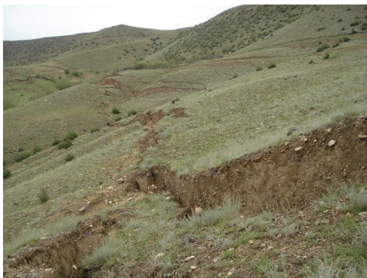
Рис. 2 Оползневые смещения на склоне Муровдагского хребта

В связи с интенсивными новейшими тектоническими поднятиями в Муровдагской зоне, с вхождением ее в более высокие холодные слои тропосферы, в моделировке и переработке ее современного рельефа заметную роль приобрела деятельность древних ледников и современных снежников. На водораздельных и приводораздельных участках гор (на высоте более 2400 м) хорошо сохранились следы верхнеплейстоценового оледенения (троговые долины, кары, цирки). В верховьях рр. Шамкирчай и Гянджачай наблюдается серия ярусно расположенных каров на высотах 2400-2600 м. В районе г. Гямышдаг кары сохранились на высотах 2800 м, 3100 м и 3280 м.