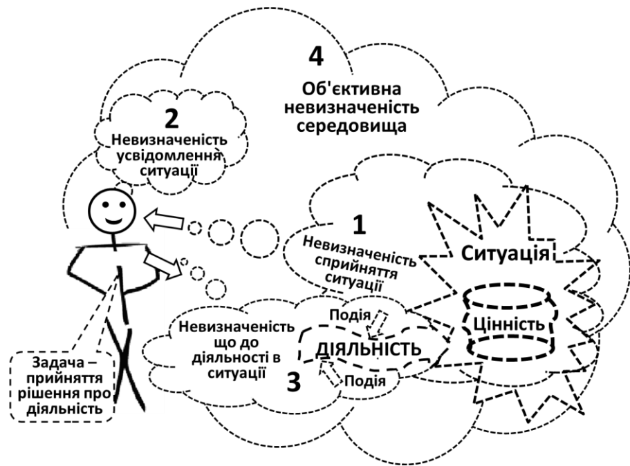
Рис. 2. Графічна модель стану невизначеності особи, якій необхідно прийняти рішення

Виходячи з цієї моделі можна запропонувати наступне визначення терміну «невизначеність».