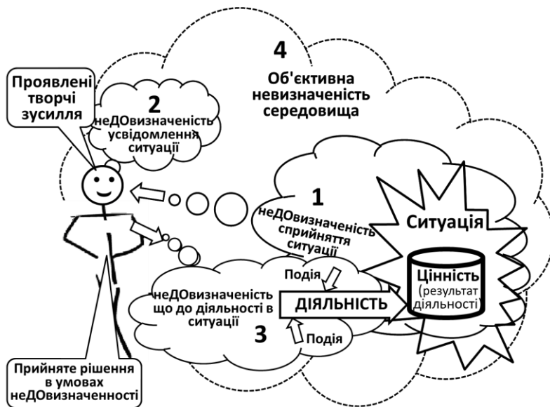
Рис. 3. Графічна модель стану умовної визначеності особи, яка прийняла рішення

А суб'єктивна ступень недовизначеності буде виступати одним з факторів (але не єдиним і не обов'язково головним) який є причиною можливого відхилення фактичного стану діяльності в конкретний момент часу від того, який планувався. Таку ситуацію називають ризиковою [67]. Як впливає з таблиці 5 при розгляді ризику основний акцент роблять на негативних наслідках відхилення. Виходячи з цього можна запропонувати наступне визначення терміну «ризик».