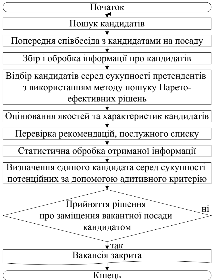
Рис. 3. Алгоритм підбору кадрів з використанням математичних методів

Алгоритм підбору кадрів з використанням математичного методу прийме такий вигляд (рис. 3).