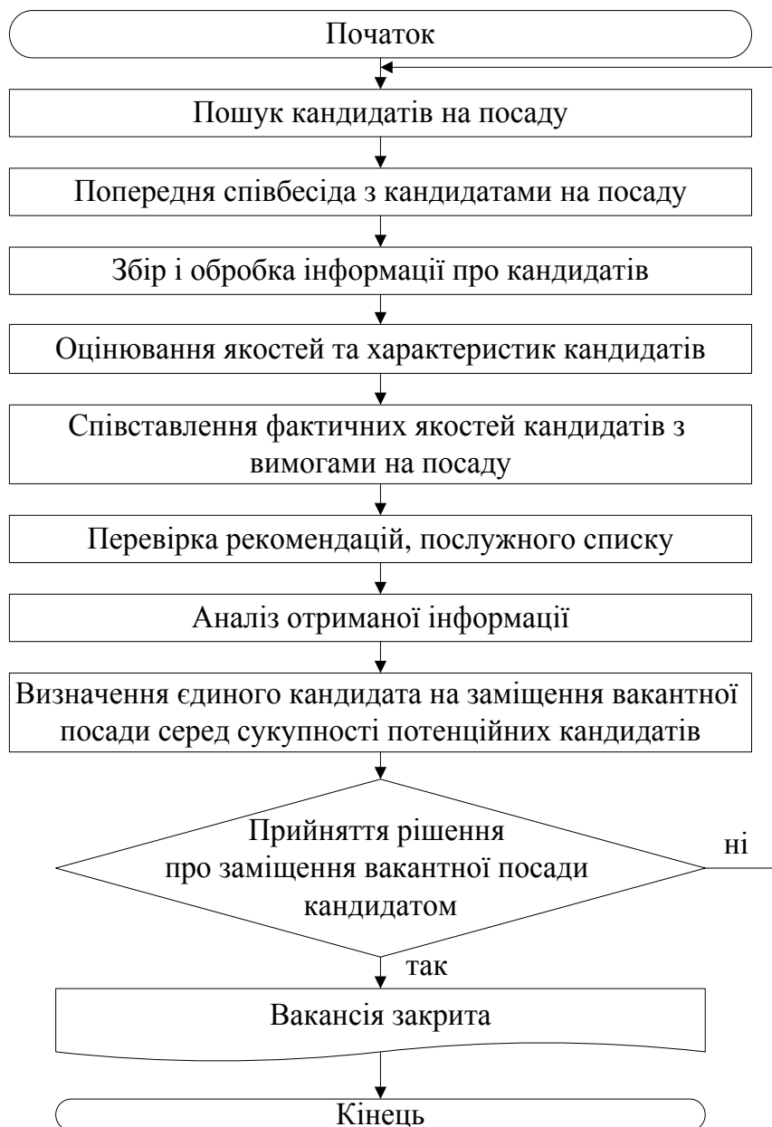
Рис. 2. Загальний алгоритм підбору кадрів

Критеріїв підбору не повинно бути надто багато, інакше процедура підбору буде занадто важкою. Основними вважаються: освіта, досвід, ділові якості, професіоналізм, фізичні характеристики, тип особистості кандидата, його потенційні можливості [3, с. 136]. Окремі компанії самостійно визначають критерії та їх кількість, які вважають важливими під час відбору кадрів. Наприклад, компанія «Microsoft» виробила шість базових цінностей, які й слугують критеріями при підборі людей на роботу [9, с. 91].