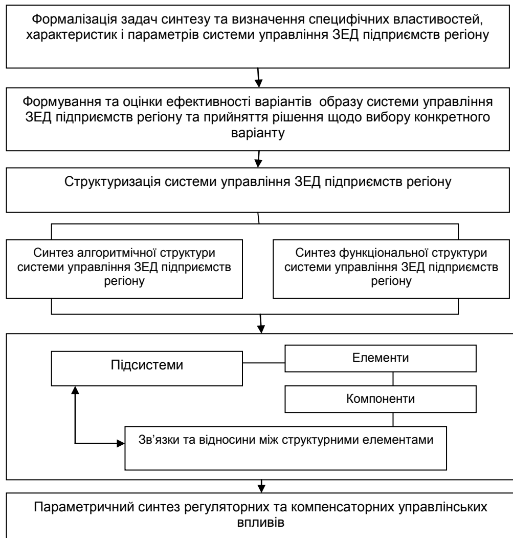
Рис. 3. Послідовність синтезу системи управління зовнішньоекономічною діяльністю підприємств регіону

Висновки. Означені положення синтезу системи управління зовнішньоекономічною діяльністю підприємств регіону визначають також напрями та специфіку побудови відповідних управлінських структур.