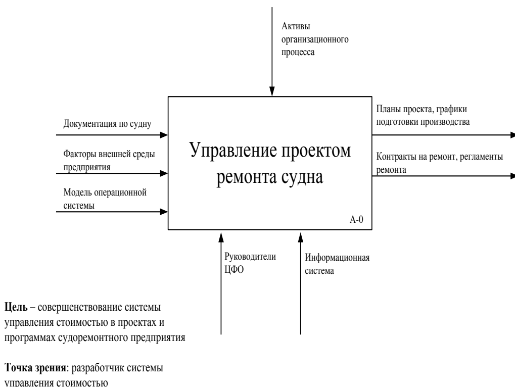
Рис. 1. А-0 Контекстная диаграмма «Управление проектом ремонта судна»

Бюджет проекта составляется на основе структуры декомпозиции функций блока А25 – «Разработка бюджета ремонта»: