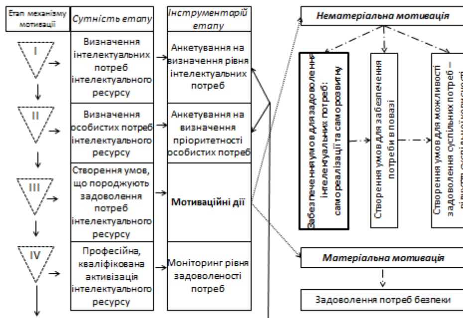
Рис. 3. Опорний механізм мотивації інноваційної праці інтелектуального ресурсу ВНЗ

займає першу шаблину, бо особистість, зайнята інноваційною працею – високоінтелектуально лабільна, емоційно вільна та раціонально достатня, тому задоволення її інтелектуальних потреб - це невід'ємний елемент її саморозвитку та самореалізації; другим етапом постає визначення особистих потреб інтелектуального ресурсу – поваги, соціальних, безпеки, фізіологічних. В залежності від пріоритетності конкретних потреб для кожного фахівця будується індивідуальний для кожного третій етап: створення умов, що забезпечують задоволення потреб інтелектуального ресурсу. Внаслідок успішного виконання перших трьох етапів – активізація інтелектуального ресурсу буде кваліфікованою та професійною. Тож, підсумувавши, можна допустити, що опорний механізм мотивації інноваційної праці інтелектуального ресурсу може мати наступний вигляд (рис. 3).