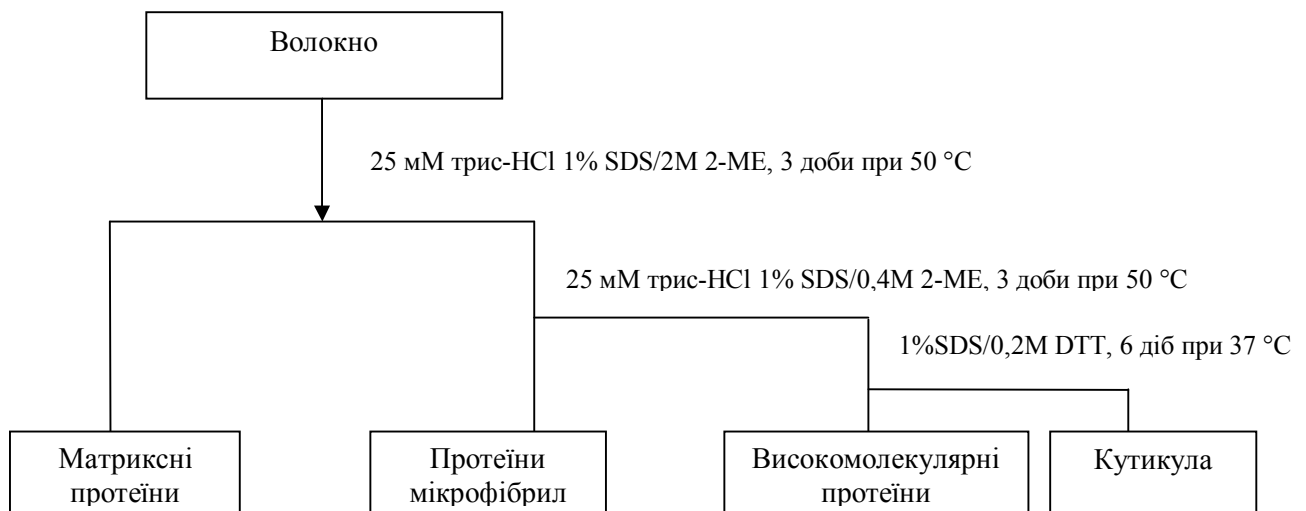
Рис. 1. Схема фракціонування вовняного волокна

Як було зазначено вище, застосований нами метод дає змогу виділити і кількісно оцінити вміст чотирьох фракцій кератину, не потребує спеціального обладнання і придатний для серійних досліджень. Оскільки даний метод не є широко вживаним, тому для зручності ми вважаємо за доцільне представити його схематично (рис. 1).