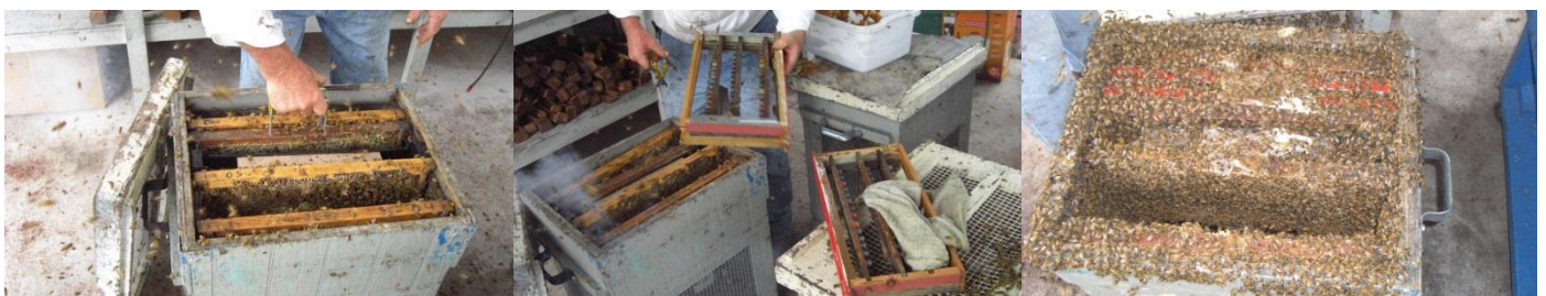
Figura 05 – Da esquerda para direita: Caixa telada (Bulk Bee Box) com operárias órfãs preparadas com alimento, introdução de cupulas, e estado populacional.

T4- Um quadro porta barrotes com 3 barrotes foi introduzido em uma caixa telada com 6 quilos de abelhas operárias, órfãs. Trinta e seis (36) horas após a introdução os quadros porta barrotes foram transferidos para uma colmeia recria com rainha composta por um ninho, sobreninho, tela excludora e sobreninho (recria) (Figuras 05 e 06).