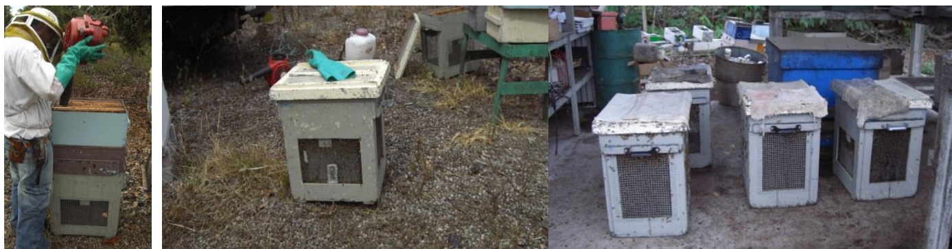
Figura 02 – Apicultor utilizando um soprador para direcionar as abelhas a caixa, na sequencia o Bulk Bee Box com abelhas.

A coleta de abelhas para o Bulk Bee Box, ou Caixa telada era feito dispondo o ninho sobre a caixa e seus quadros eram sacudidas e/ou sopradas, com equipamento para este fim, para que as abelhas caíssem no interior do mesmo com o auxílio de um funil adaptado ao padrão Langroth de colméias. Os ninhos possuíam tela excludora para não capturar a rainha na coleta dos sobreninhos. Neste processo foram utilizadas o numero de colônias necessárias para suprir a quantidade de abelhas requerida. (Figura 02) (PEREIRA, 2010).