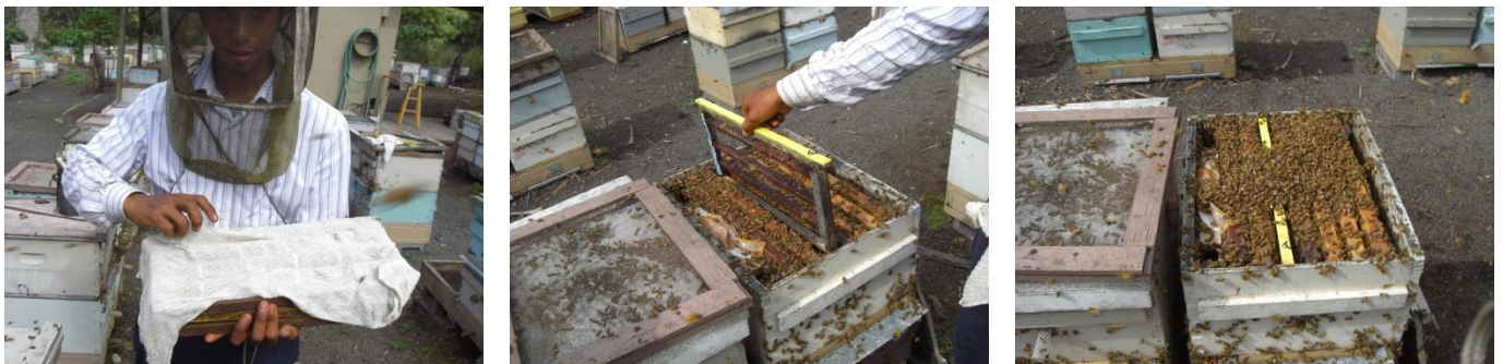
Figura 04 – Da esquerda para direita: Transporte dos quadro porta cupulas, introdução nas recrias, e estado populacional do enxame.

T3- Um quadro porta barrotes com 3 barrotes foi introduzido em uma caixa telada com 6 quilos de abelhas operárias, órfãs, trinta e seis (36) horas após a introdução os quadros porta barrotes foram transferidos para uma colmeia recria com rainha composta por um ninho, tela excludora e sobreninho (recria) (Figuras 05e 06);