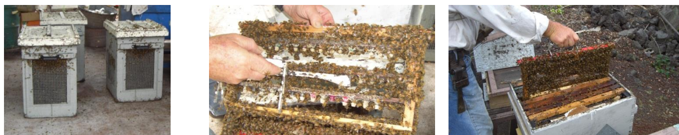
Figura 06 – Da esquerda para direita: Caixas teladas (Bulk Bee Box) com operárias orfãs, 36 horas após a introdução coletaram-se as cúpulas que forma introduzidas nas colméias recria Doolittle (1889) dupla e tripla.