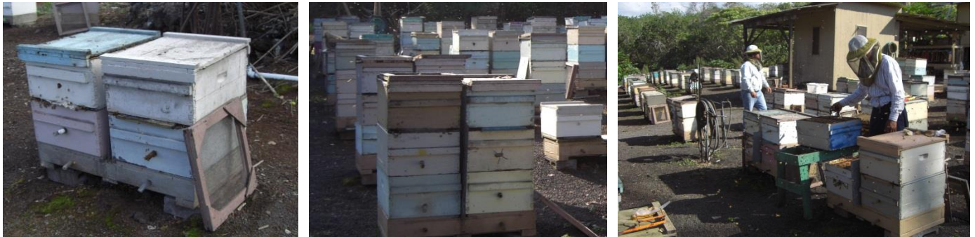
Figura 03 – Da esquerda para direita: Colméias recria com ninho e sobreninho; Colméias recria com ninho e 2 sobreninhos; Apiário com colméias recria de rainhas.

T2- Um quadro porta barrotes com 3 barrotes foi introduzido em uma colmeia Recria Iniciadora-Terminadora com rainha em postura (DOOLITTLE, 1889), composta por ninho, sobreninho 1, tela excludora e sobreninho 2 (recria) (Figuras 03, 04);