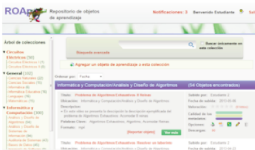
Figura 4. Interfaz repositorio y visualización de resultados.

La Figura 4 muestra la interfaz principal del repositorio y la forma como se muestran los resultados al usuario después de capturado su perfil y realiza una búsqueda a partir de un objetivo específico.