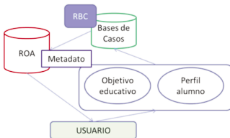
Figura 2. Modelo de selección personalizada de recursos educativos.

En la vida real, para cada curso se definen los objetivos educativos que se deben cumplir. En el perfil del estudiante se debe conservar la información de los logros ya obtenidos, como de las variables psicopedagógicas representadas por el Estilo de Aprendizaje, obtenido mediante un test.