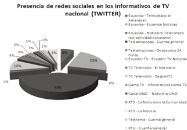
Figura 1. Informativos en Twitter.

1) Resultados de las fichas de análisis a las nueve cadenas de Tv nacional de Ecuador (Ecuavisa, Teleamazonas, Ecuador TV, TC Televisión, Canal Uno, Gama TV, RTS, Telerama y RTU), sobre su actividad en redes sociales: