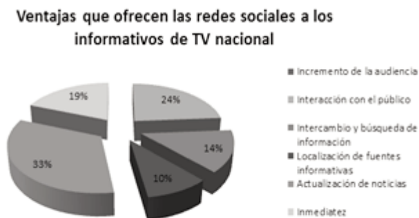
Figura 4. Ventajas de las redes sociales a los informativos de TV nacional.

Ecuador TV vuelve a elevar el índice y denota una notable importancia de las redes sociales en sus informativos, que aunque no iguala el nivel de Ecuavisa, muestra una tendencia marcada de utilizar redes sociales dentro de los informativos, ya sea para proporcionar contenido a través o para involucrarla dentro de los noticieros, generando actividad con quienes están al otro lado de la pantalla.