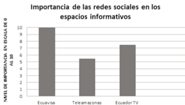
Figura 3. Importancia de Redes Sociales en los informativos de Ecuavisa, Teleamazonas, Ecuador TV.

2) Resultados de las encuestas efectuadas a los presentadores/directores de noticias de las tres cadenas de TV.