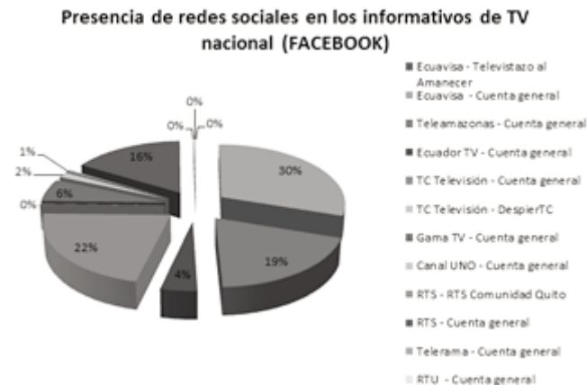
Figura 2. Informativos en Facebook.

De acuerdo al número de seguidores en ésta red social, la cuenta general Teleamazonas, Ecuavisa Noticias (Ecuavisa) y Ecuador TV Noticias (Ecuador TV) son las cuentas de informativos con mayor presencia en Twitter. Se evidencia que aunque Teleamazonas no posee una cuenta destinada específicamente a sus emisiones informativas, supera en seguidores a quienes la tienen. De hecho, su cuenta creada para “Desayunos 24 Horas” no logra la presencia y alcance que tiene la cuenta del canal, aunque es actualizada con información constantemente.