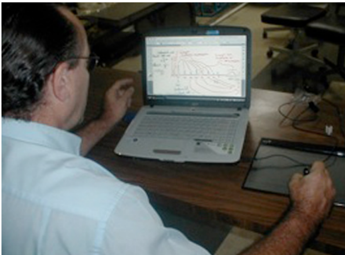
Figura 1: Pizarra digital

Nótese que lo que aparece en la pantalla de la computadora portátil, que es lo que el docente va escribiendo y explicando, se proyecta en la pantalla que los estudiantes están observando (figura 2). Tiene las ventajas de la pizarra tradicional y dos adicionales: