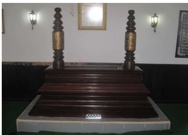
Gambar 10.6. Jirat dan nisan Noto Igomo

Nisan makam Noto Igomo yang terbuat dari kayu ulin baik utara maupun selatan bentuk dan ukurannya sama. Inskripsinya pun sama. Berita yang ingin disampaikan pada kedua nisan itu pun sama. Yang membedakan hanyalah, inskripsi bagian utara semuanya ditulis dalam huruf Arab, sementara di bagian selatan ada yang ditulis dalam huruf Latin.