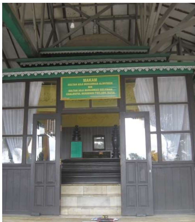
Gambar 10.3: Bilik makam Sultan AM. Alimuddin dengan inskripsinya