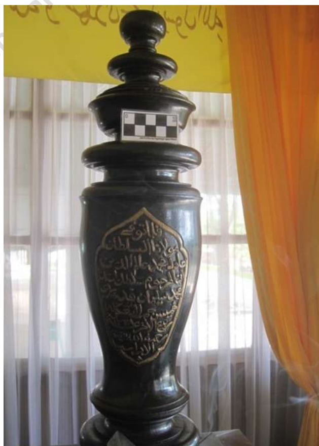
Gambar 10.4: Nisan Sultan AM. Alimuddin dengan inskripsinya