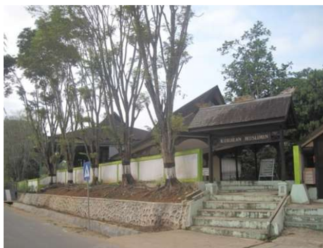
Gambar 10.1. Komplek Pemakaman Kelambu Kuning di Jl. Sultan Aji Muhammad Alimuddin, Gunung Gandek.