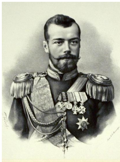
Рис. 1. Император Николай II

Власть в условиях усугубления алкогольной зависимости населения сначала пыталась понять это социальное явление, однако вскоре перешла к активным противодействующим мерам. Сложный процесс подготовки государственного регулирования питейного дела начался в период царствования императора Александра III. Именно в это время рассматривался и обосновывался целый ряд законопроектов, среди которых были создание Попечительства о народной трезвости и введение винной монополии. Однако внезапная смерть в 1894 г. не позволила Александру III реализовать задуманное, и это стало делом его сына императора Николая II.