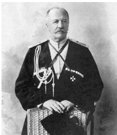
Рис. 1. Граф И.И. Воронцов-Дашков

Либеральное дворянство и буржуазия видели в царизме силу, способную оградить их сословные и имущественные привилегии и держать в повиновении трудящиеся массы. Правда, в первые дни революции либеральная буржуазия встала в оппозицию к самодержавию, но стоило царскому правительству изъявить согласие на созыв Государственной Думы, т.е. продемонстрировать начало диалога, как либералы, вступили на путь тесного сотрудничества с царским правительством.