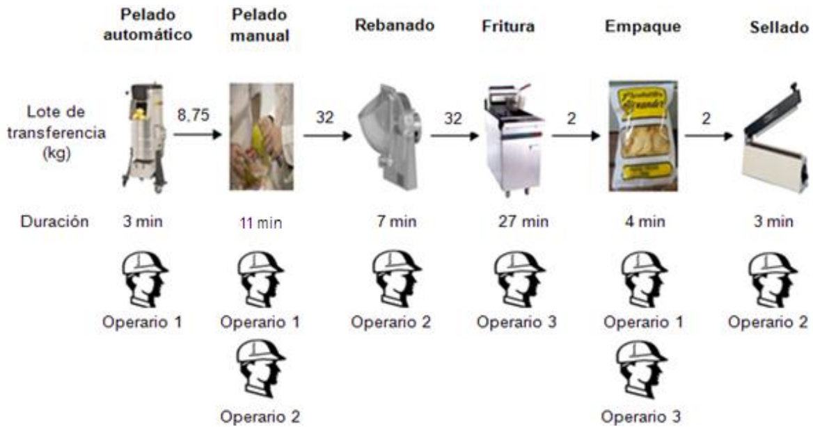
Figura 2. Situación actual del proceso de elaboración de snacks

Para incrementar el Trúput es preciso trabajar todo el tiempo posible en la restricción del sistema, esto se lo hace a través de una mejor programación de la producción donde el proceso de fritura tiene una duración de 8 minutos, es decir, que cada operación se repite nuevamente cada 8 minutos con la finalidad de que este proceso no se quede desabastecido utilizando un lote de transferencia ideal de 9 kg fijado para todas las operaciones ya que la capacidad máxima de la restricción es de 9 kg y lo que se busca es que ésta trabaje utilizando toda su capacidad y el mayor tiempo posible durante la jornada lo que a su vez contribuye a agilizar de alguna manera el proceso y resolver problemas de manera rápida, se ha propuesto también la programación de actividades para cada uno de los operarios dentro del proceso lo que permite fijar turnos para el almuerzo de los mismos evitando que el proceso de fritura se detenga.