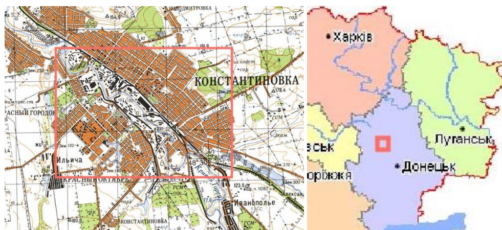
Рис. 1. Схема розміщення Костянтинівської ділянки

Результати та їх обговорення. Ми дослідили ґрунти як біля Костянтинівського свинцево-цинкового комбінату, так і у межах фонової ділянки (табл. 2 – 4, рис.1).