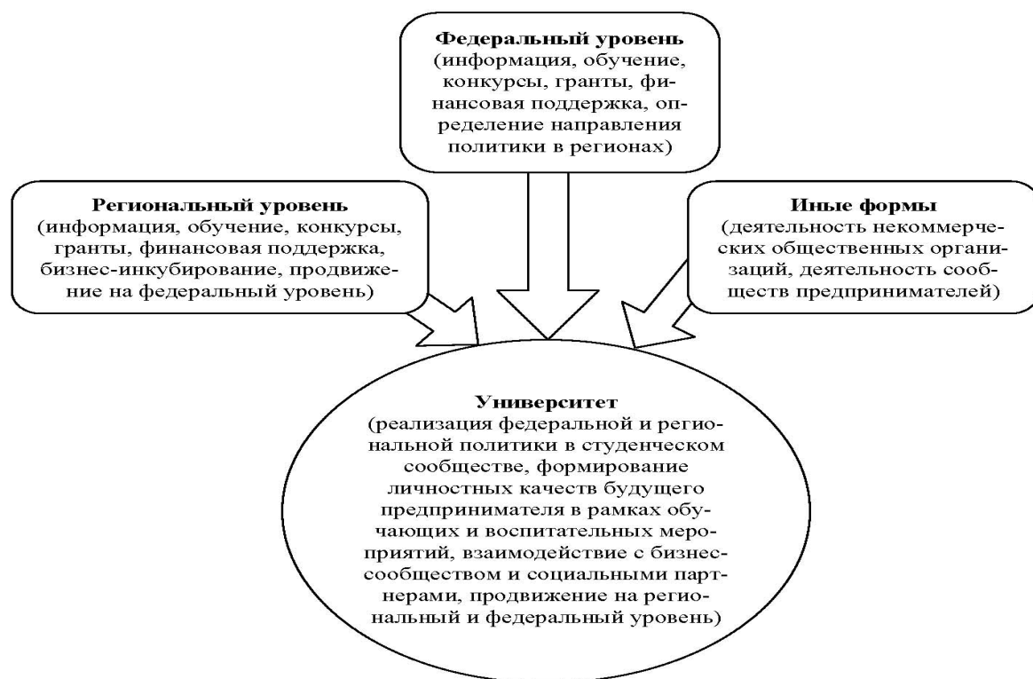
Рис. 1. Схема уровневой системы поддержки молодежного предпринимательства в РФ

Вуз, как социальный и образовательный институт, в ряду своих целей должен ставить повышение мотивации студентов к занятию предпринимательской деятельностью, позиционирование бизнеса, как альтернативы работы в муниципальном, государственном или частном учреждении в качестве наемного работника. А также создавать необходимые условия для информирования студентов о современных условиях развития бизнеса, обучения их теоретическим основам, а также практическим знаниям и умениям.