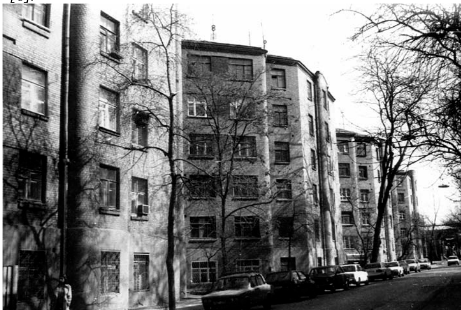
Комплекс жилых кооперативов «Новый быт» в Ростове-на-Дону.

Сосуществование различных типов домов, владельцы которых принадлежали к разным социальным группам, было явлением распространенным. Так, в Петербурге «до революции центр застраивался двумя типами домов – так называемыми лицевыми и дворовыми флигелями. “Барские” лицевые флигели, выходявшие на улицу, располагали всевозможными удобствами, нередко даже лифтами, парадным и черным ходом, избыточной высотой комнат и предназначались для солидных платежеспособных квартирантов – промышленников, банкиров, крупных чиновников, врачей, адвокатов. Дворовые флигели рассчитаны были на жильцов иного достатка – непритязательных мелких чиновников, ремесленников, пролетариев. Эти строения не только стояли “стена к стене”, но и внутри отличались теснотой и неудобством» . При этом степень обеспеченности последних канализацией и водопроводом колебалась от 98 до 12 % [7]. Для строительства жилья использовался в основном «местный, подручный материал» : «Строили дома, они были примитивные, что такое саманные дома, Вы знаете. Или планованный дом – это когда деревянная основа, обитая планками, и она набивалась глиной. А вот кирпичные дома – это была редкость, это были только богачи, местные