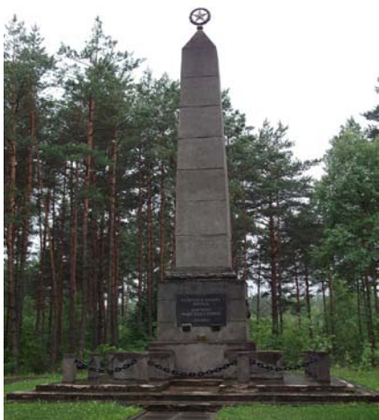
Фотоархив А.Черкасски: Понары 2011