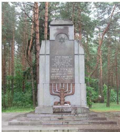
Понары 2011

История памятника в Понарах весьма репрезентативна для всего Советского Союза с послевоенного периода вплоть до 1980-х годов. Как выше сказано, сооружение памятников в общественных местах являлось государственным делом. Таким образом, частные памятники могли быть поставлены только на кладбищах, да и то с разрешения властей.