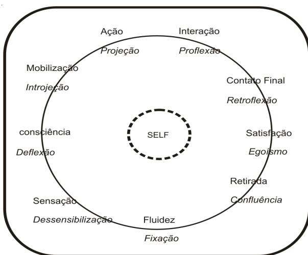
Figura 1. O “Ciclo do Contato” baseado no modelo apresentado por Ribeiro (1997)

O Ciclo do Contato proposto por Ribeiro (1997, Figura 1), representado por Bloqueios, fornece uma visão das diversas possibilidades de contato realizadas pelo indivíduo; completa-se um ciclo seguindo os passos, que mostram formas de relacionamento com o meio: fluidez/fixação, sensação/dessensibilização, consciência/deflexão, mobilização/introjeção, ação/projeção, interação/proflexão, contato final/retroflexão, satisfação/egotismo, retirada/confluência.