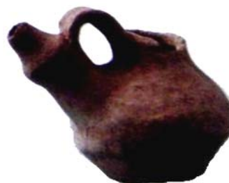
Рис. 5. Водолей-мургоби. Городище Торткуль, XI – XII вв.

Широкое распространение в Семиречье получили так называемые сосуды – «утки» или водолей-мургоби (рис. 5). Сосуды, изображающие утку, считались символами единства неба, земли и воды и имели отношение к мифам о создании земли и земного мира. Многие из них использовались в обрядовой практике празднования Наурыза – Нового года. Представления об утке или гусе как о космической птице распространены довольно широко. Объясняя космогонический сюжет, изображенный на культовых хорезмийских сосудах, Ю. А. Рапопорт предположил, что в хорезмийской традиции происхождения вселенной изначально божество представлялось в образе водоплавающей птицы. Рапопорт не исключал также, что образ водоплавающей птицы соответствует представлениям об изначальной водной стихии [8, с. 67 – 68]. Сосуд со сливом в виде быка, видимо, использовался в дни празднования Ноуруза, в день, когда был создан Гайомарт – быкочеловек, из тела которого произошли виды зерна и растения, а из семени – бык и корова, мужчина и женщина.