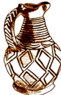
Рис. 2. Гордище Жуантобе, VII – VIII вв.

элемент андроновского орнамента – меандр – встречается на керамике и облицовке зданий Семиречья и Южного Казахстана на протяжении всей средневековой эпохи. Исследователи видели в нем то символ воды, то движения, в частности, движения солнца по небосклону [2, с. 311].