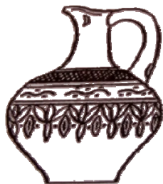
Рис. 6. Горodiще Садыр-Куган, IX – X вв.

жреческое учение о душе усопшего, заключенной в растении, о грядущем ее воскрешении сливаются с пережитками первобытных анимистических представлений.