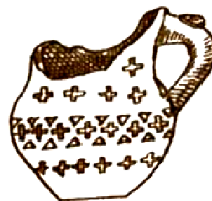
Рис. 3. Жетысы, VII – IX вв.

На сосудах встречается елочный орнамент, указывающий направление. Можно использовать этот элемент как признак, выделяющий определенную зону на сосуде. Так, если ёлочки расположены вверх, значит, скорее всего, на сосуде большее смысловое значение несет орнамент в зоне «среднего мира», а если ёлочки имеют направление вниз, то выделяется «нижний мир». Помимо ромбов и ромбической сетки, распространенным составляющим элементом в геометрическом орнаменте были треугольные и сферические фигуры. Ярким примером таких геометрических изображений служат орнаменты на кувшине IX – X вв. с антропоморфными признаками из Куйрыктобе, антропоморфном кувшине из музея АГУ им. Абая, на сосуде с зооморфными признаками VI – VIII вв., найденном при раскопках храма 2 в Куйрыктобе. Кресты – это элемент орнамента, являющийся характерной изобразительной чертой талгарской керамики, и довольно редко встречающийся на сосудах в других регионах Семиречья (рис. 3).