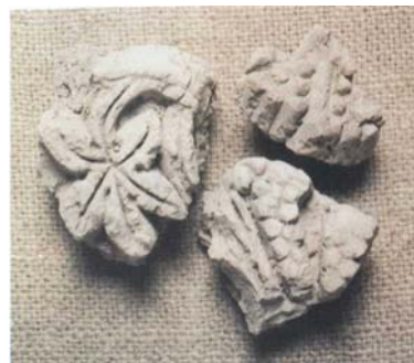
Рис. 8. Фрагменты резной композиции с изображением винограда. Костобе, VIII – IX вв.

Отдельную группу составляла архитектурная керамика. Художественная резьба по толстому слою сырой штукатурки – резной штук – украшала культовые постройки IX – X вв. Так украшались ниши и стеновые панели. Характерными были геометрические мотивы (меандры, полосы, круги, овалы), растительные (лозы винограда, пучки цветов, тюльпаны), эпиграфические (стилизованные изображения букв). Распространенный элемент растительного орнамента в архитектурном декоре – это виноградная лоза, гроздь винограда (рис. 8).