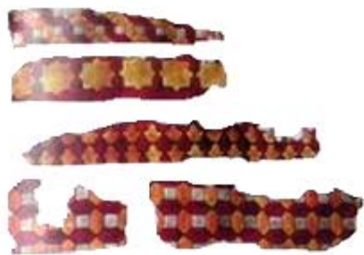
Рис. 9. Фреска первой бани Тараза

Общие растительные и геометрические мотивы выстраиваются в одинаковые сюжетные линии как в украшении стен храмов и мечетей, так и на сосудах, порой найденных в помещениях этих зданий.