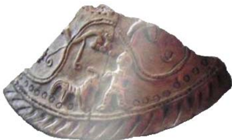
Рис. 7. Фрагмент крышки IX – X вв., Тараз

Целый ряд культовой керамики представляют крышки сосудов, навершия которых выполнены в виде головы барана или трехрогого и двухрогого животного (рис. 7). Это указывает на давно бытовавший среди полукошевого и оседлого населения культ барана. Налепами в виде рогов барана была обрамлена ниша в святилище городища Кок-Мардан (однокомнатная постройка размером 4 x 4). Три рога в шаманизме служат обозначением священной принадлежности богов, жрецов [5, с. 200 – 207] и животных. Демоны – сатиры и силены изображались с рожками и лошадиными ушами, лошадиными и козлиными копытами, лошадиными хвостами, а торс и голова у них человеческие.