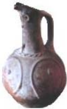
Рис. 1. Кувшины с изображением женской груди. Тараз, IX – X вв.

Антропоморфные признаки на сосудах, как правило, переданы с помощью орнамента в технике резьбы, наклепов, гравировкой по сырому и штампами. К антропоморфным признакам относятся изображения ушей, рта, волосистой покров, «мужские» (пирамидальные налесты на верхних изгибах ручек) и «женские» (грудь в виде трех шишечек на тулове или прочерчиваний) признаки (рис. 1) [7, с. 93]. Реже встречаются «андрогинные» керамические предметы, то есть совмещающие мужские и женские признаки.