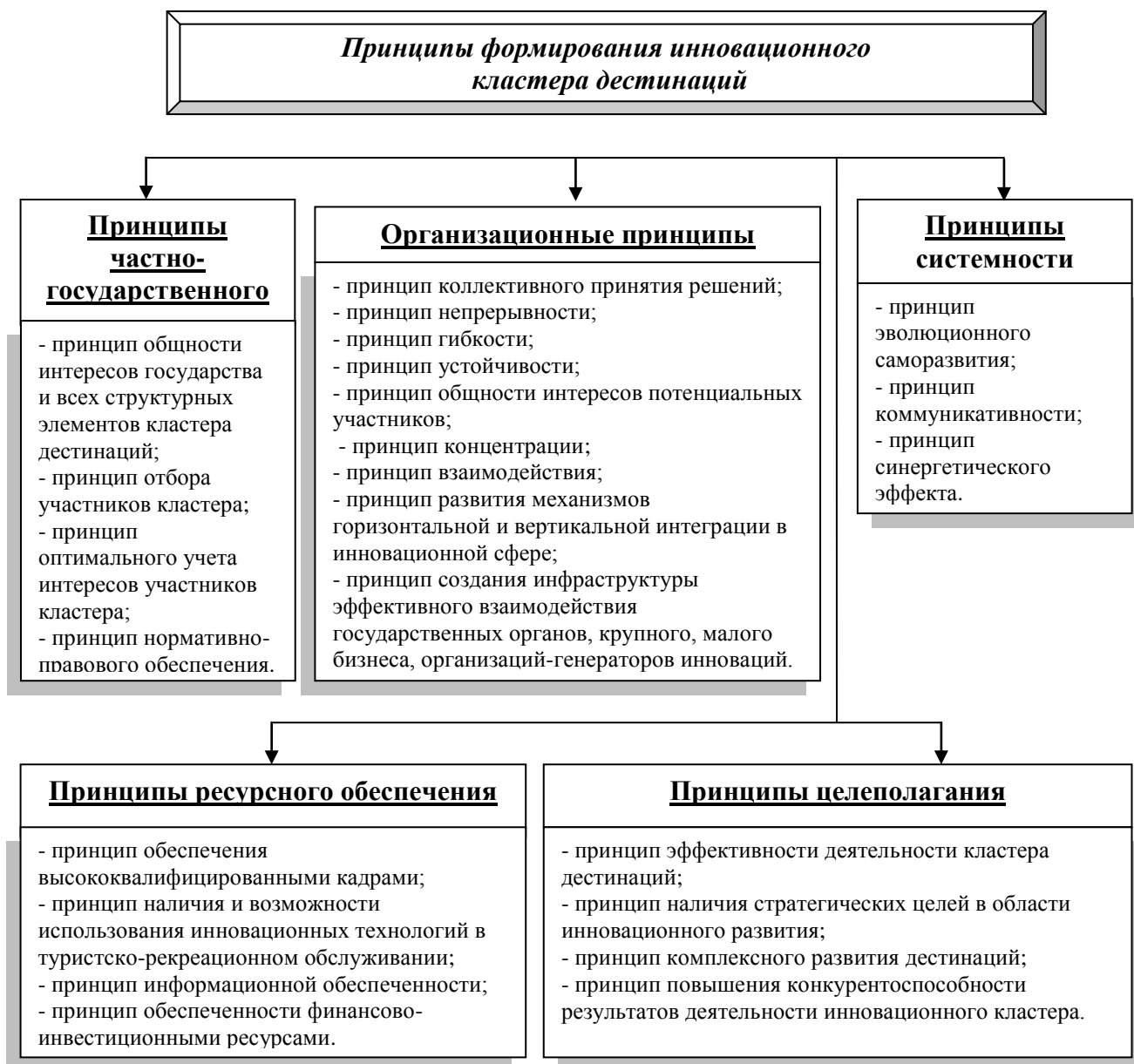
Рис. 1. Принципы формирования ИКД

Основными признаками, характеризующими возможность формирования ИКД, являются: производственно-технологическая взаимосвязь организаций туристско-рекреационной сферы; территориальная локализация; наличие развитой инфраструктуры, обеспечивающей трансфер технологий; гибкость состава и структуры; отсутствие жестких формальных ограничений и барьеров [9], препятствующих расширению и сужению кластера; открытость кластера как системы.