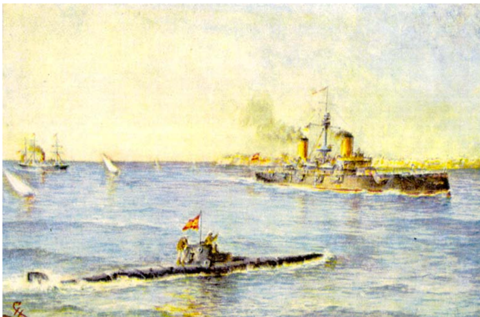
Подводная лодка Пираля во время испытаний в надводном положении.

Непосредственно перед ходовыми испытаниями 6 марта состоялась торжественная церемония первого подъема боевого флага. А далее по системе каналов Сан Фернандо лодка вышла в Кадисскую бухту, чтобы приступить ко второй группе испытаний из выработанного списка.