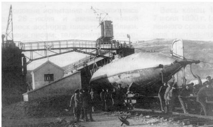
Подводная лодка Пералья на верфи. 1890 г.

Сигарообразный корабль Пералья своей формой сильно напоминал мину Уайтхеда. Два его винта приводились в движение электрическим двигателем, запитываемым от аккумуляторов. Других двигателей лодка не имела. Кстати, для полной зарядки всех 613 бортовых батарей потребовалось несколько дней. Сначала думали, что столь длительное время необходимо только для самой первой зарядки, но впоследствии оказалось, что это «нормальный» процесс, и для работы двигателя обычно требовалось не меньше 18 часов зарядки.