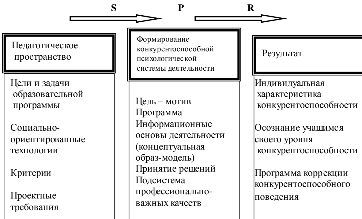
Рис. 2. Функциональные блоки психологической системы учебной деятельности

Программа деятельности. Программа отражает структуру деятельности и определяет, что должен делать субъект в конкретное время. При этом выделяются программы трех уровней: