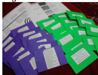
Figura 3 – Ferramenta Lúdica