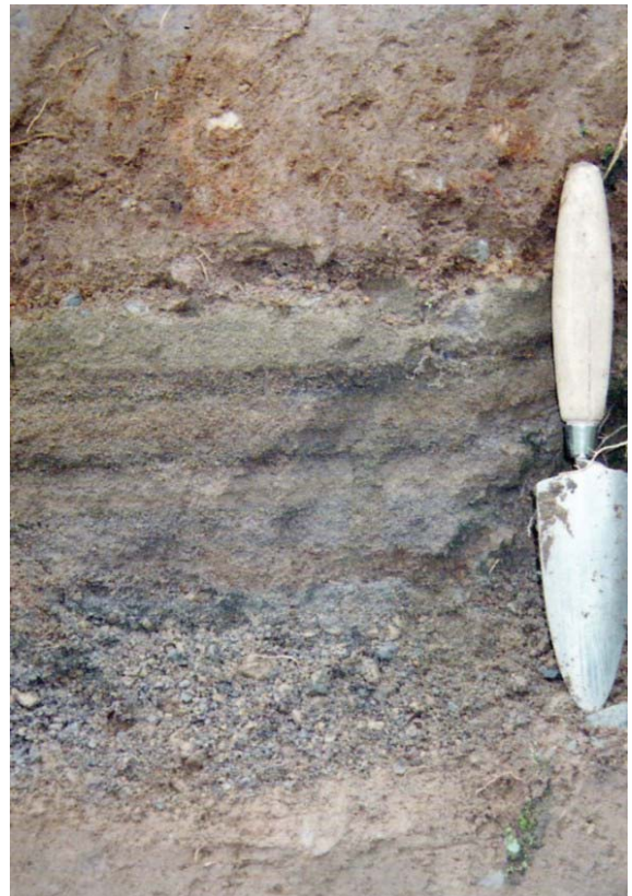
Gambar 2. Selo tefra tersusun atas perulangan jatuhnya piroklastik (pf), tersingkap di lereng utara Merapi, di daerah Plalangan.

Berkaitan dengan pernyataan Labberton (1922) tentang pralaya yang berhubungan dengan kejadian vulkanik, terdapat prasasti yang menyebutkan tentang letusan gunung api, yaitu Prasasti Rukam. Prasasti ini berangka tahun 829 Saka (907 M) dan ditemukan di Desa Gondosuli, Kecamatan Bulu, Temanggung. Dalam prasasti tersebut dikatakan bahwa Desa Rukam telah rusak akibat letusan gunung api. Namun tidak disebutkan asal letusan gunung tersebut.