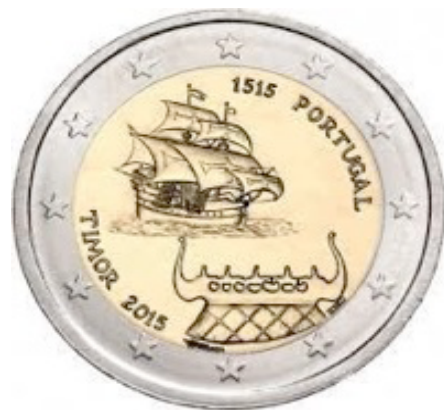
Imajen 3: Koin Euro 2 prodúz iha Portugal hodi selebra tinan 500 Portugal nia 'Misaun Sivilizasaun' to'o iha Timor-Leste