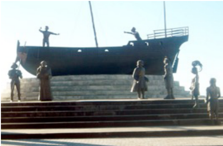
Imajen 2: Monumentu iha Oekusi nudar parte ida hodi selebra tinan 500 Portugal nia 'Misaun Sivilizasaun' to'o iha Timor-Leste

koin 2 Euro (haree imajen 3 no 4) ho fotografia ró-ahi Portugal nian tau iha leten no uma lulik iha kraik. Tamba sá mak fotu rua nia la tau horizontal ho pozisaun hanesan? Bele diskute, Timor-Leste hanesan nasaun úniku iha mundu ne'ebé selebra sira nia kolonizadór mai iha rai laran. Timoroan barak la kontente ho asaun ida ne'e husi Governu tamba ba sira, bainhira Portugés sira komesa sama ain iha Timor-Leste, sira la'ós lori sivilizasaun, maibé sira lori sofrimentu, disastre, destruisaun no miseria oioin ba populasaun tomak. Hamenus krueldade koloniál nian iha tempu pasadu no simplesmente hare hanesan 'misaun sivilizasaun' hanesan esforsu ida atu 'habeik públiku' ( pembodohan masa ) uza Timoroan sira nia ignoránsia no pasividade.