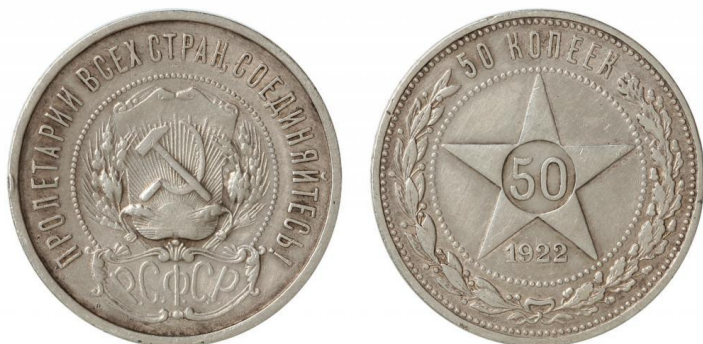
Рис. 5. Аверс и реверс 50-копеечной монеты