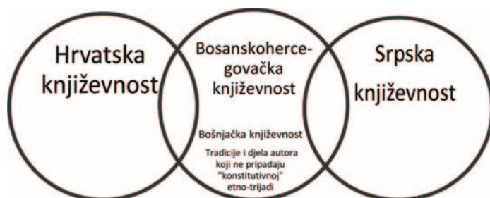
Grafikon 1. Kompozitna integralnost bosanskohercegovačke književnosti prikazana u Spahić (2017)

Modificirajući ideju preklapljenih elipsi kao modela suegzistencije i interferencije južnoslavenskih nacionalnih književnosti zasnovanog na decentriranom dvofokalnom sistemu gravitacionih centara, Spahić zastupa figuru krugova koji se međusobno preklapaju pri tome zadržavajući svaki svoj centar i periferiju. Upravo uvažavanje koncepta kompozitne integralnosti, smatra Spahić, ispostaviće se kao ključna pretpostavka razumijevanja bosanskohercegovačkog kulturnog identiteta, u okviru kojeg se kulturne tradicije bosanskohercegovačkih naroda nalaze u specifičnom odnosu obilježenom stalnim osciliranjem između bosanske integralnosti i nacionalnih posebnosti (Spahić 2017: 7). Spahić smatra da ovakav pristup daje potrebnu širinu u razumijevanju nacionalnih književnih identiteta, koje ne suspendira, već naprotiv afirmira mogućnost dvojne ili višestruke pripadnosti pisca pojedinim književnostima, te isti predstavlja simbolično u vidu krugova koji se međusobno dodiruju i križaju: