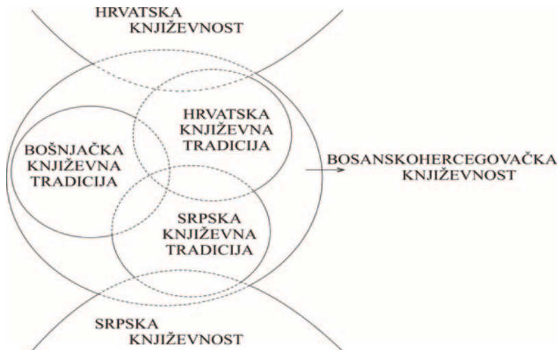
Grafikon 3. Interferentnost književnih tradicija na užem bosanskohercegovačkom i širem južnoslavenskom prostoru

Stoga, linija razgraničenja unutarnjeg i vanjskog, onog što pripada jednoj kulturi/tradiciji/identitetu nikada nije čvrsta i nepropusna, nego porozna i elastična. Iz toga proizilazi da bi se Spahićev i Lovrenovićev model bosanskohercegovačke kulture i književnosti mogli prošiti uz naglašavanje propusnosti granice unutar i van svake od navedenih tradicija, a što bi se moglo predstaviti i na sljedeći način: