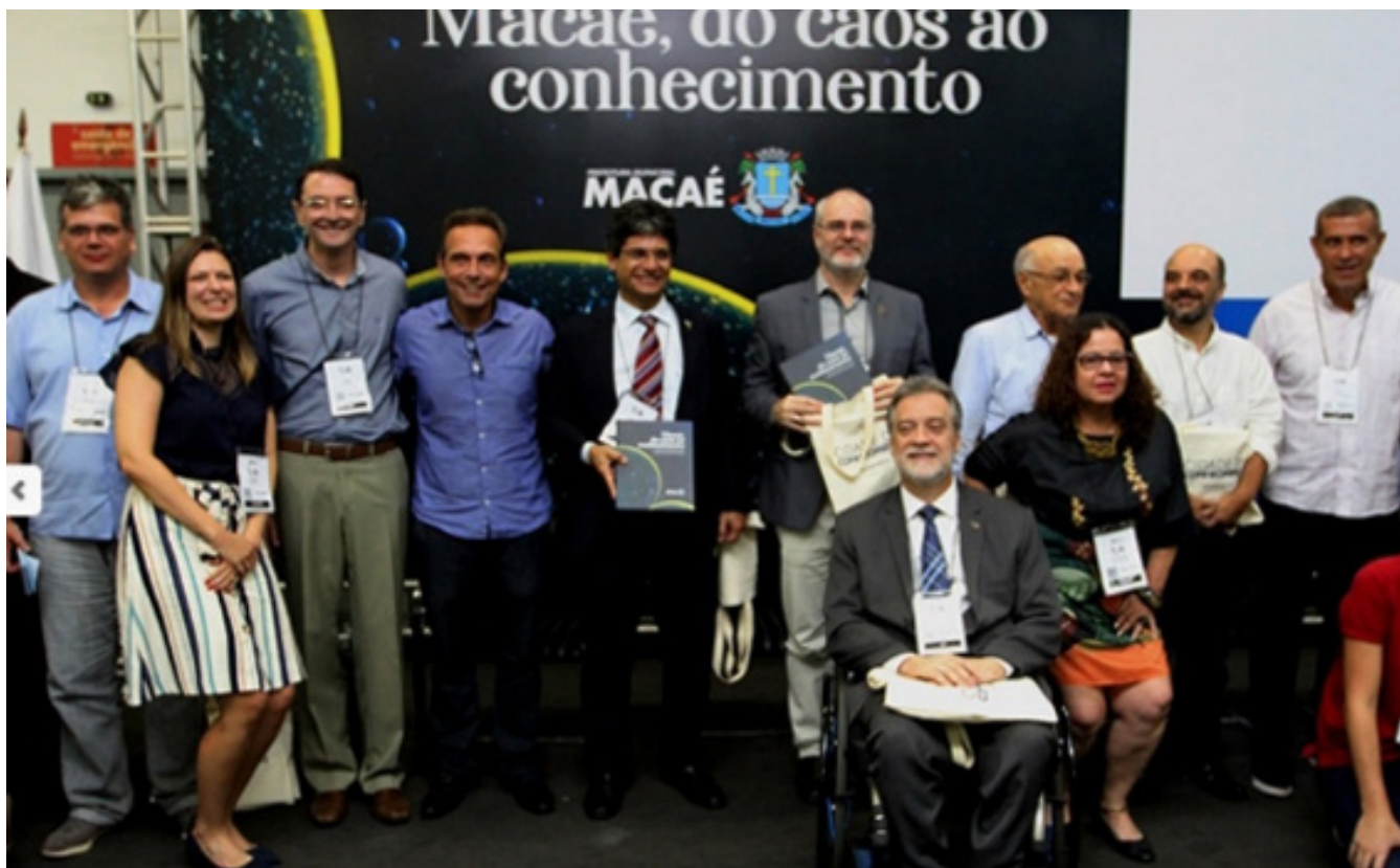
Figura 2. membros do observatório, reitores das instituições de ensino, membros do poder público e representantes da sociedade civil no lançamento do livro “Macaé, do caos ao conhecimento” - Feira Brasil Offshore, 2019