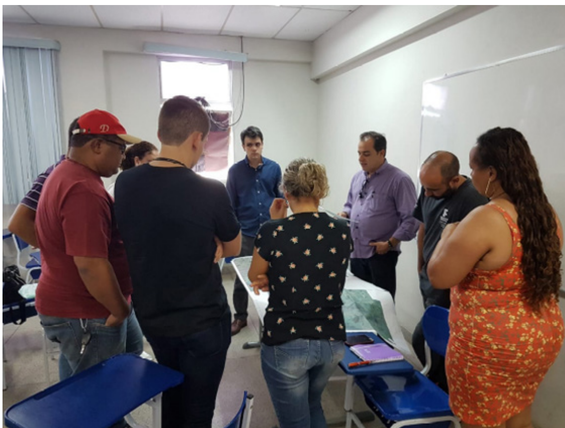
Figura 1. Membros do observatório se reúnem com integrantes da Secretaria Municipal de Desenvolvimento Econômico