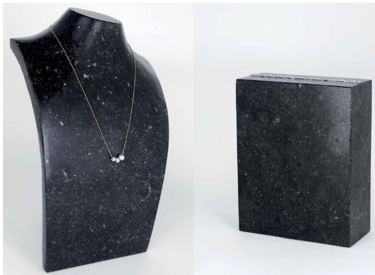
Fig. 7 - Various Artists, aza.Pearl , 2014–2015.