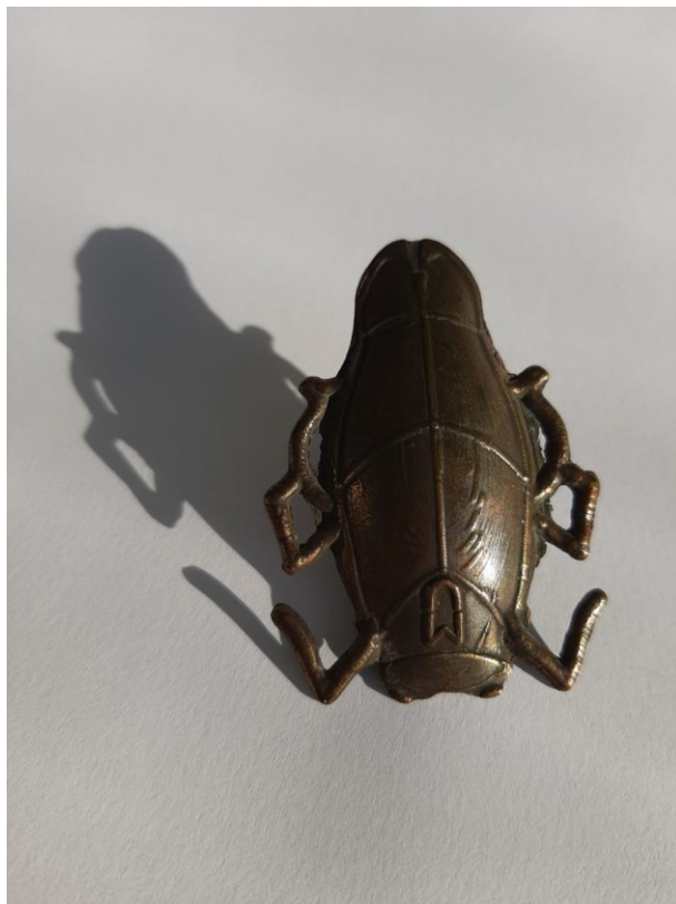
Fig. 3 - Cildo Meireles, Cigarra , 2010.