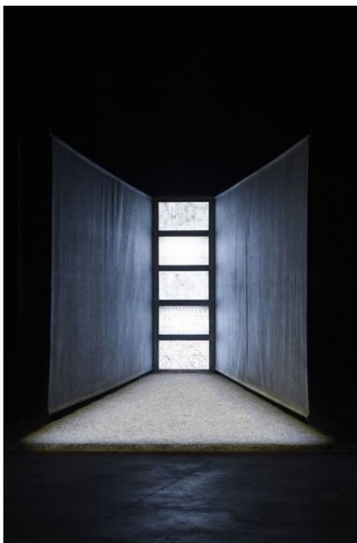
Fig. 9 - Cildo Meireles, Para Pedro, 1984-1993.