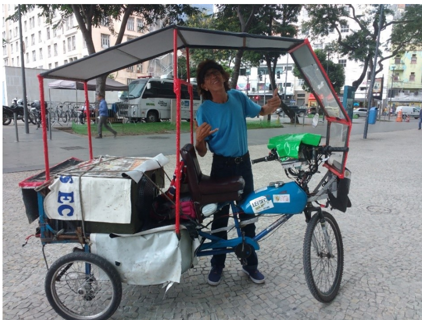
Fig. 4 - Cildo Meireles, Liverbeatlespool , 2014.