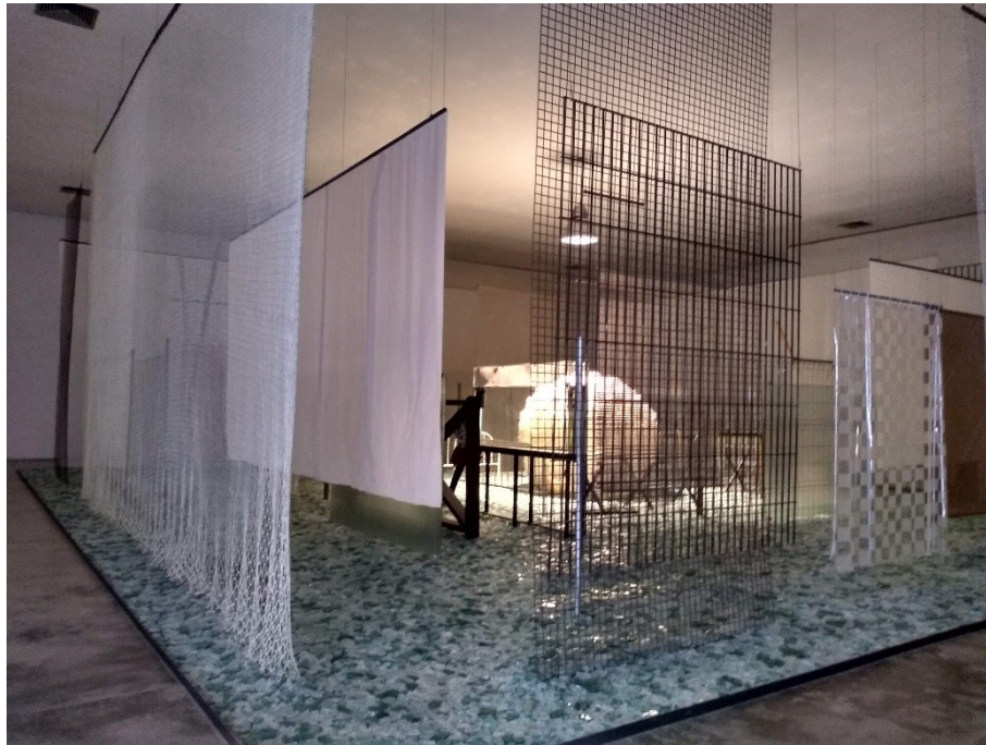
Fig. 1 - Cildo Meireles, Através, 1983-1989. Instituto Inhotim, Brumadinho, MG