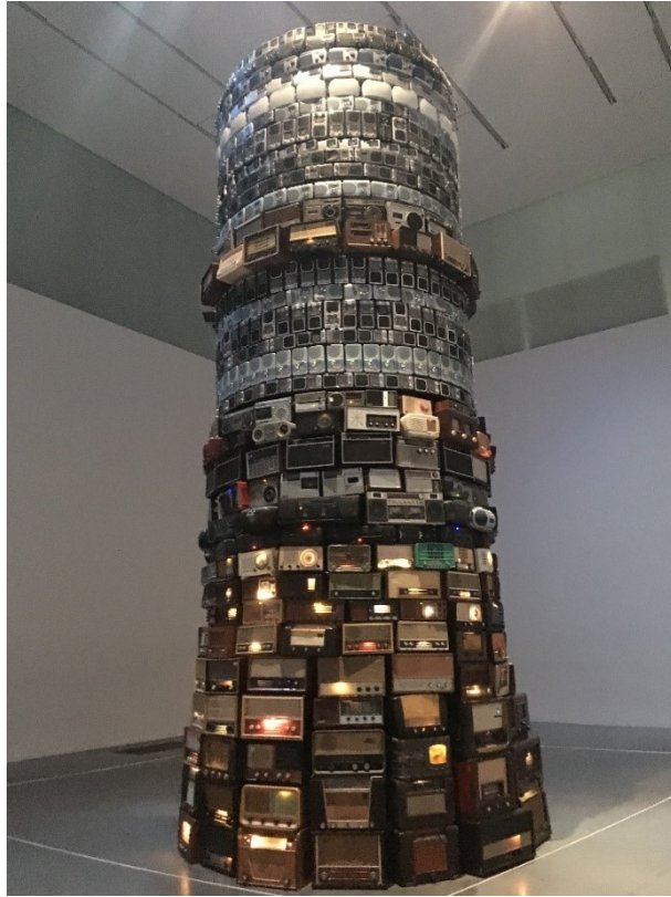
Fig. 11 - Cildo Meireles, Babel , 2001.