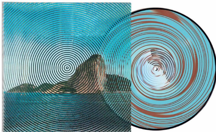
Fig. 8 - Cildo Meireles, rioir , 1976-2011.

(Fonte: Catálogo da exposição Entrevendo: Cildo Meireles , Sesc Pompeia, SP)