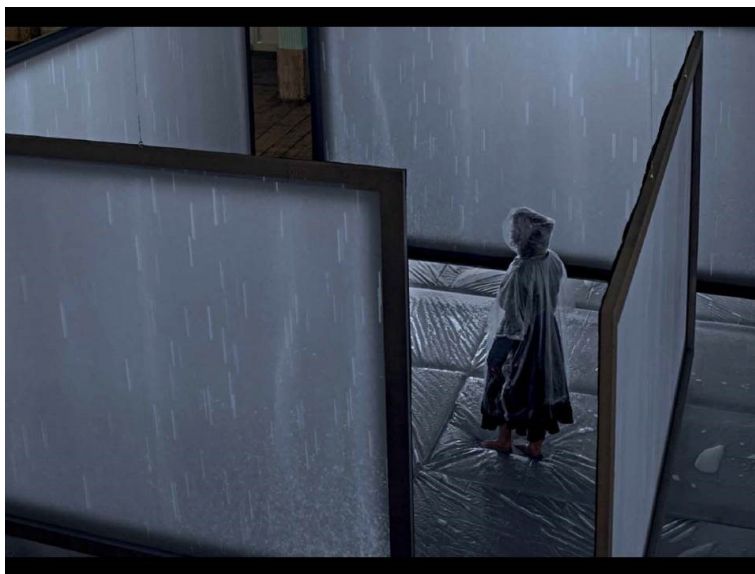
Fig. 6 - Cildo Meireles, Chove Chuva, 1995-2015. Galleria Continua, San Gimignano (Itália)