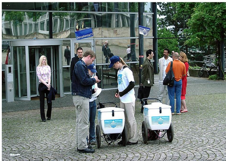
Fig. 5 - Cildo Meireles, Elemento desaparecendo/Elemento desaparecido (passado iminente) , 2002.