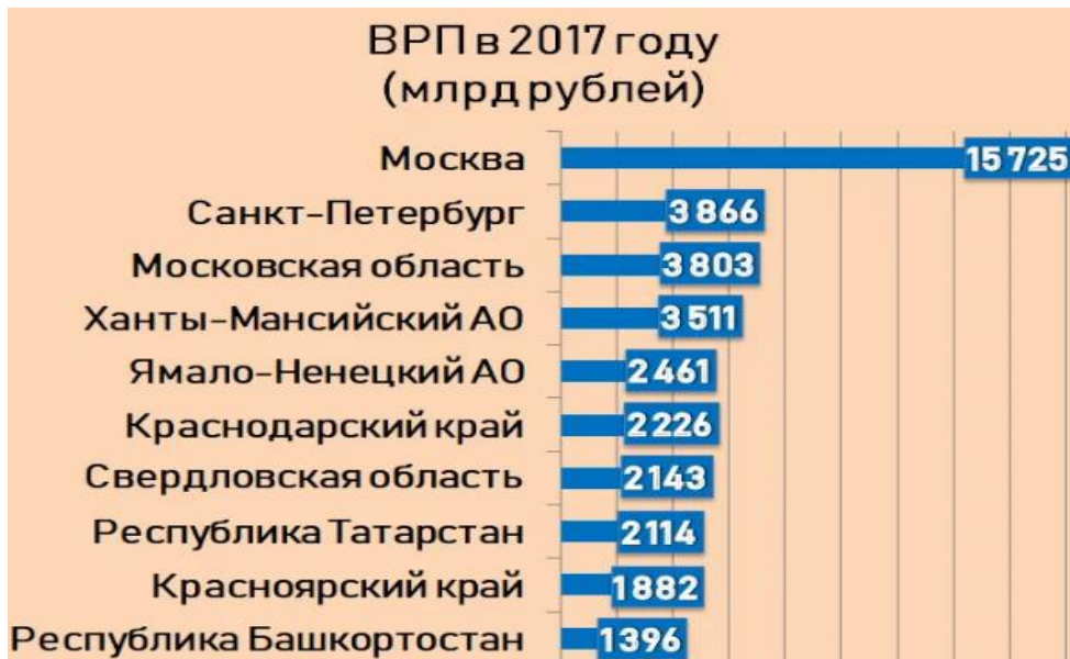
Рис. 1. Топ регионов России по объёму ВРП в 2017 году

Краснодарский край всегда являлся одним из основополагающих регионов нашей страны, хоть и не всегда он был самодостаточным. В этом мы можем убедиться по Рисунку 1 и Рисунку 2 .