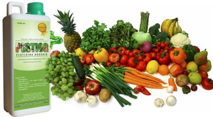
Gambar 3. Pestisida Nabati Pestior