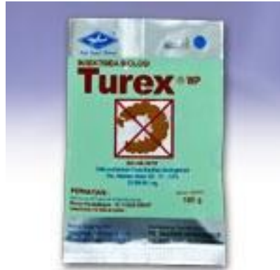
Gambar 4. Pestisida biologi merk Turex

pavonana pada tanaman kubis, penggerek pucuk Helicoverpa armigera pada tanaman tembakau dan hama penggerek buah Heliothis armigera pada tanaman tomat.