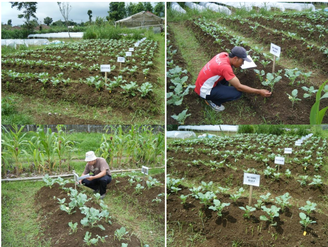
Gambar 6. Petak percobaan dan pengamatan.

Senyawa aktif tanaman mimba tidak membunuh hama secara cepat, tapi berpengaruh terhadap nafsu makan, pertumbuhan, daya reproduksi, proses ganti kulit, menghambat reproduksi sel telur dan perkawinan, penurunan daya tetas telur, dan menghambat pembentukan kitin (Schmutterer, 1990; Mordue & Blackwell, 1993; Saber et al., 2004; Raguraman & Singh, 2004).