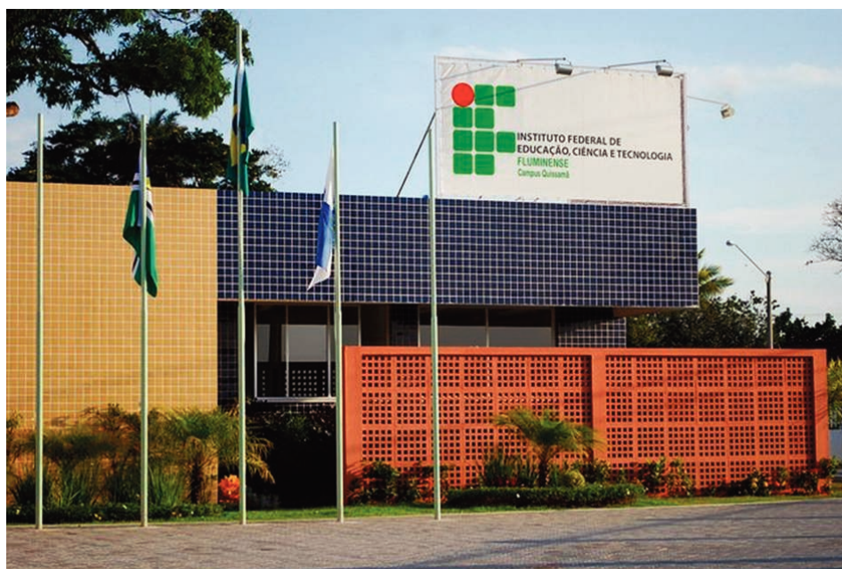
Figura 1. Imagens do campus Quissamã do Instituto Federal Fluminense. Coordenadas: 22°06'38.4"S 41°28'51.7"W

A metodologia aplicada neste trabalho consiste em calcular a PE através das emissões de CO 2 geradas pelo consumo de combustível dos veículos oficiais, energia elétrica, água e papel, além da área construída do Campus Quissamã do IFFluminense. Não foram incluídos nos cálculos da PE o consumo de alimentos pelos discentes e a geração de resíduos. A exclusão dos alimentos deve-se à falta de dados oficiais e à variabilidade diária e sazonal do consumo desse item. Não há informações quanto à quantidade de resíduos sólidos gerados diariamente. A gravimetria desse resíduo e a sua disposição final precisam ser avaliadas de forma criteriosa para serem inseridas em pesquisas futuras.