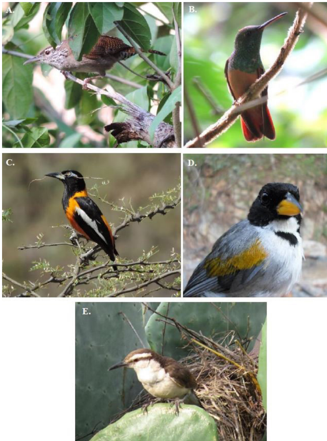
Figura 3. Especies focales de aves importantes para la conservación en el Cañón del Chicamocha, Colombia. A, cucarachero de Nicéforo ( Thryophilus nicefori ); B, amazilia ventricastaño ( Amazilia castaneiventris ); C, turpial guajiro ( Icterus icterus ); D, pinzón alidorado ( Arremon schlegeli canidorsum ); E, cucarachero chupahuevos ( Campylorhynchus griseus bicolor ). Fotografías: Sergio A. Collazos-González.