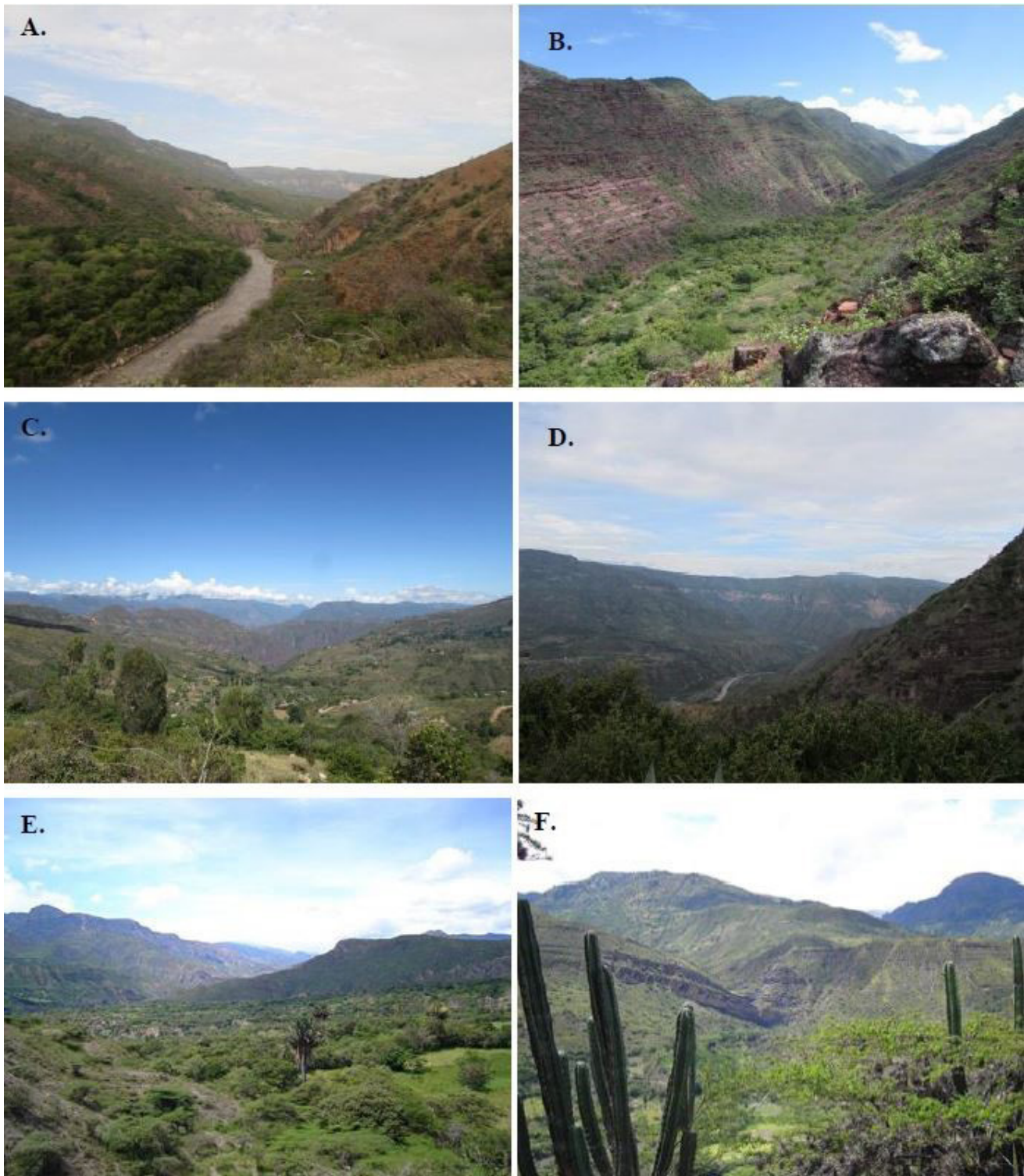
Figura 2. Paisajes de algunas localidades de estudio visitadas en el Cañón del Chicamocha, Colombia. Santander: A, Jordán-Los Santos; B, Los Fríos-Los Santos; C, La Purnia-Los Santos; D, La Mojarrá-Los Santos. Boyacá: E y F, Soatá.