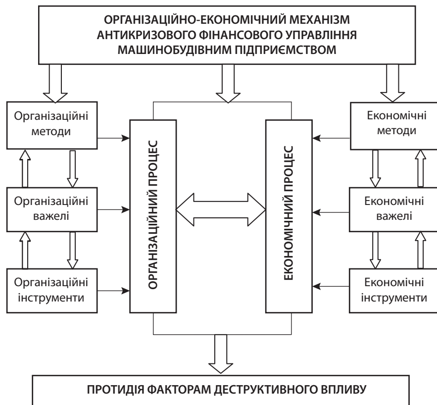
Рис. 2. Структура організаційно-економічного механізму антикризового фінансового управління машинобудівними підприємствами

Збірник наукових праць Черкаського державного технологічного університету. Серія «Економічні науки». 2012. Вип. 32 (1). С. 127–130.