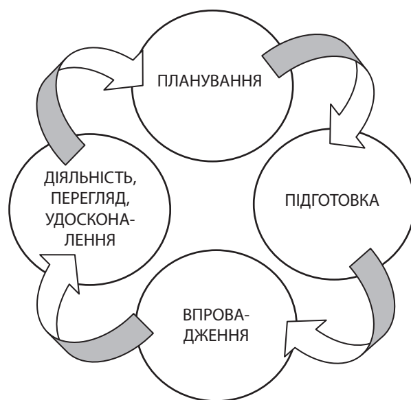
Рис. 2. Процес залучення стейкхолдерів

Процес залучення стейкхолдерів AA1000SES включає чотири етапи, що наведено на рис. 2.