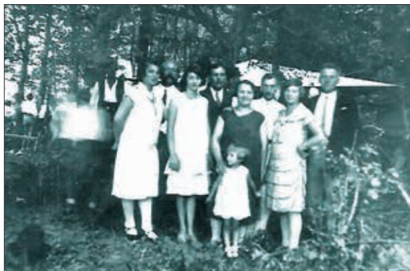
Slika 2. Vikend na Česmi

Sastanak svih članova Športskog ribarskog društva Česma radi dogovora o organiziranju prve velike javne društvene manifestacije, izleta na obližnju, sedam kilometara udaljenu rijeku Česmu održan je 9. kolovoza 1929. Tom prilikom podijeljeni su zadaci. Prvi društveni izlet na Česmu doživio je značajan uspjeh. Odaziv građanstva na izlet organiziran 13. kolovoza 1929. bio je iznad svih očekivanja, što se najbolje vidi iz izvještaja tajnika J. Žlutickog podnesenog na šestoj sjednici odbora, održanoj 30. studenog 1929. u gostionici Brcković . Između ostalog, Žluticky je tada rekao da si je društvo „uzelo... za zadaću da i na zabavno-prosvjetnom polju zainteresira šire slojeve građanstva za ovdje dosta nepoznati ribarski šport...“ pa je „...organiziralo jedan oveći izlet spojen s raznim natjecanjima i zabavom vani na vodi na zraku na suncu našeg potoka Česme pod imenom Weekend...“. (6)