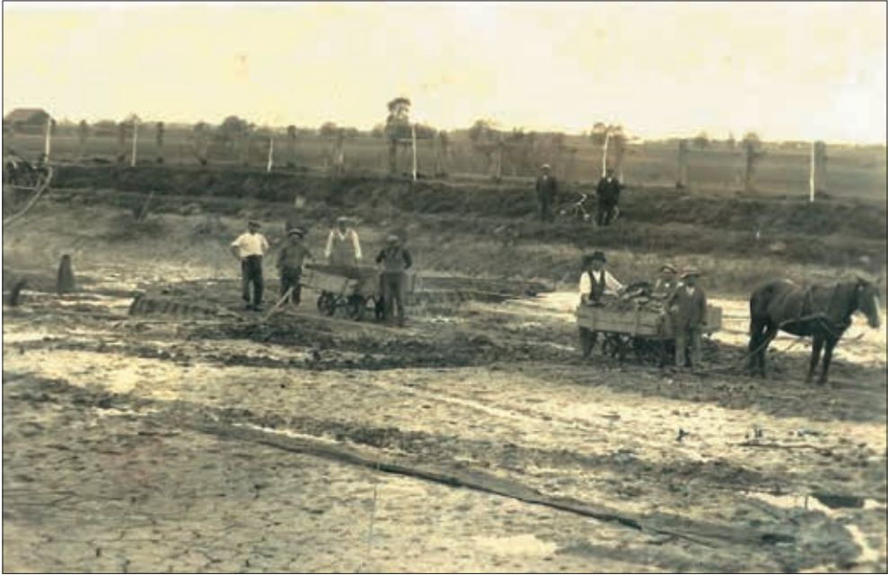
Slika 3. Izgradnja bjelovarskih ribnjaka u Mlinovcu počela je 1930.

u društvo iznosila je 25 dinara. Prema lovnom redu, te godine članstvu je bila zabranjena upotreba poklapača i velike mreže na Česmi. Bio je dozvoljen samo križak „saptar“ i sak. Lov velikim mrežama bio je dozvoljen samo u organizaciji društva i u društvene svrhe.