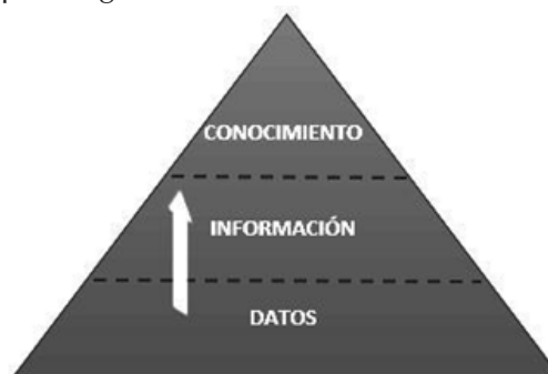
Figura 1. Pirámide del conocimiento

Dentro del significado de BI se deben resaltar tres conceptos que podrían parecer sinónimos: datos, información y conocimiento [9]. Los datos son la mínima unidad semántica y se corresponden con elementos primarios de información que por sí solos son irrelevantes como apoyo a la toma de decisiones. También se pueden ver como un conjunto discreto de valores que no dicen nada sobre el porqué de las cosas y no son orientativos para la acción. La información se puede definir como un conjunto de datos procesados que tienen un significado (relevancia, propósito y contexto) y que, por lo tanto, son de utilidad para quien debe tomar decisiones [10]. En la Figura 1, se observa el flujo para la generación del conocimiento.