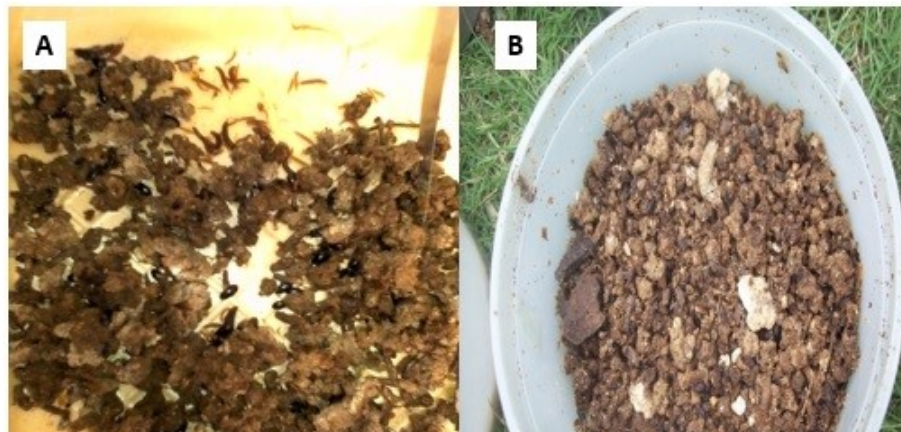
(a) adultos y larvas de A. diaperinus , (b) muestra de excremento de codorniz