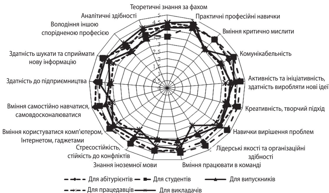
Рис. 2. Карта сприйняття компетентностей фахівців з вищою освітою з позиції ключових стейкхолдерів

Процеси глобалізації та інформатизації, розвитку економіки знань сприяли підвищенню мобільності працівників, що зумовило необхідність адаптації закладів вищої освіти до нових умов конкуренції на ринку послуг вищої освіти. Виходячи з цього зростає роль маркетингу в налагодженні взаємодії між суб'єктами даного ринку. За результатами апробації запропонованого науково-методичного підходу виявлено невідповідність очікувань та важливості для ключових стейкхолдерів сформованих компетентностей у фахівців з вищою освітою в процесі навчання