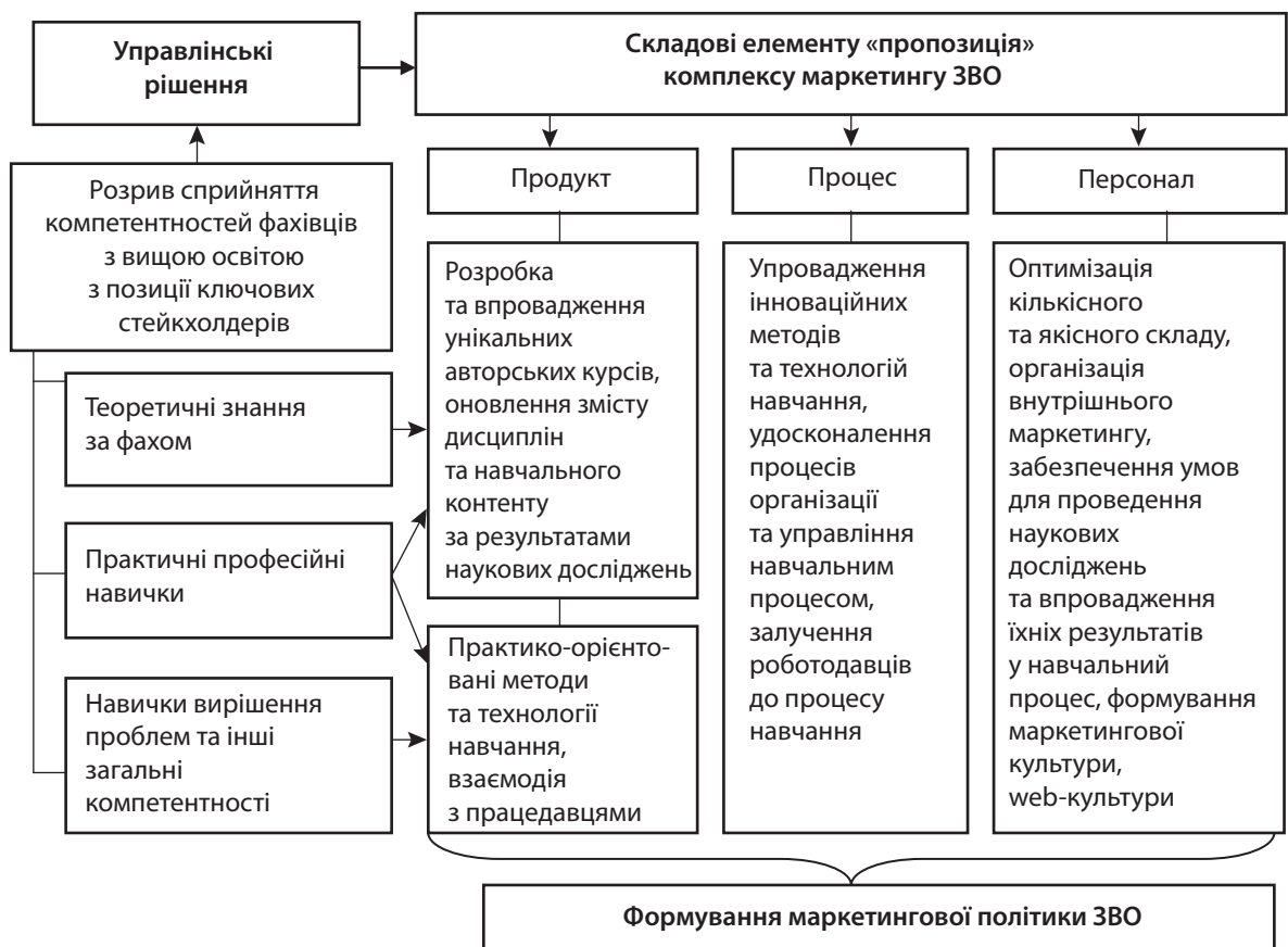
Рис. 3. Рекомендовані управлінські рішення щодо нівелювання розриву у сприйнятті компетентностей фахівців з вищою освітою

у закладах вищої освіти. Виявлено, що для узгодження інтересів ключових стейкхолдерів на ринку продуктів вищої освіти важливо приділяти увагу набуттю не лише м'яких навичок (soft skills), на які наразі звертається увага, але й посилювати професійні (hard skills) компетентності в напрямку формування практичних навичок професії, уміння вирішувати професійні проблеми, володіння спорідненою професією.