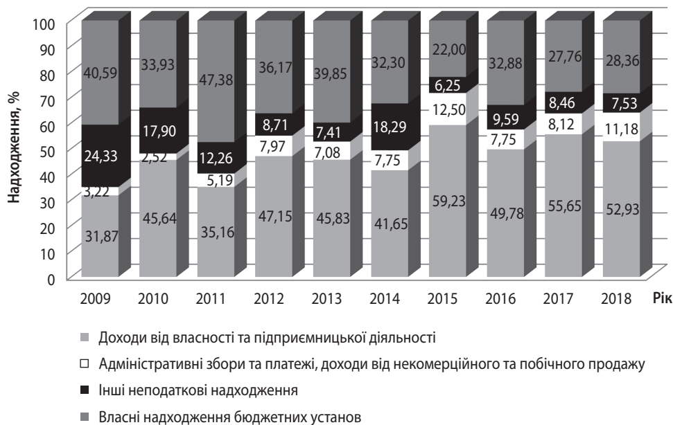
Рис. 2. Структура неподаткових надходжень за 2009–2018 рр. у Державному бюджеті України

Так, у структурі неподаткових надходжень інші неподаткові надходження відображають тенденцію до зменшення: з 24,33% у 2009 р. до 7,53% у 2018 р., але якщо порівнювати надходження у грошових коштах, то вони зберігаються на рівні 12 млрд грн. Натомість адміністративні збори і платежі показують тенденцію до зростання: з 3,22% у 2009 р. до 11,18% у 2018 р. Причиною цього є стимулювання держави щодо продажу ліцензій на радіочастоти в Україні та судовий збір.