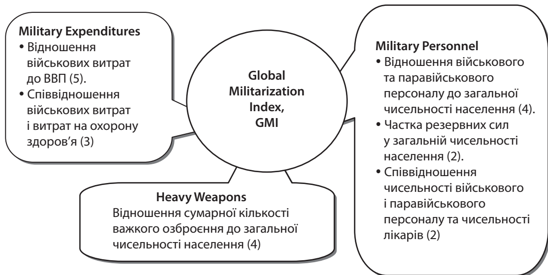
Рис. 3. Субіндекси та базові показники Global Militarization Index (GMI)

У рейтингу GMI-2018 із 155 країн 109 належать до груп з високим і дуже високим рівнем мілітаризації (GMI > 0,600). Найбільш мілітаризованими виявилися: Ізраїль, Сінгапур, Вірменія. У топ-10 мілітаризованих країн потрапляють також Росія та Білорусь (табл. 3). За час збройного протистояння з Росією на Донбасі укріпилися мілітаристські позиції України – у рейтингу GMI-2018 Україна посіла 14 місце, піднявшись порівняно з 2013 р. на 8 сходинок.