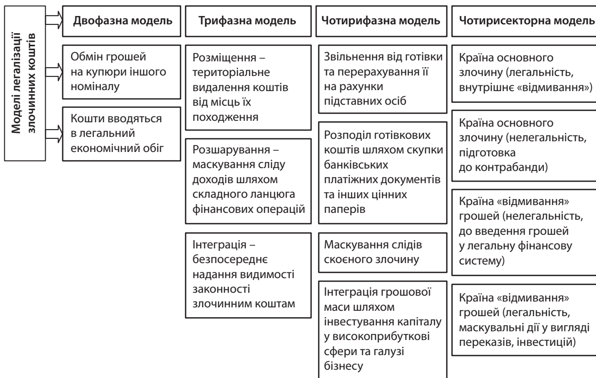
Рис. 1. Моделі легалізації коштів, отриманих злочинним шляхом

При обслуговуванні фізичних осіб підвищений ризик для банку з позицій залучення в процеси відмивання злочинних доходів і фінансування терориз-