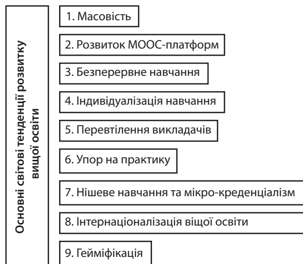
Рис. 1. Основні світові тенденції розвитку вищої освіти

Автори світових форсайт-прогнозів щодо розвитку вищої освіти виділяють такі головні тенденції в цій сфері (рис. 1).